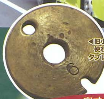
◀旧小坂鉄道で 使われていた タブレット(実物)

ローカル JR 花輪線から 路線バスに 乗り継いで、 旧小坂鉄道の魅力を 再発見する旅。